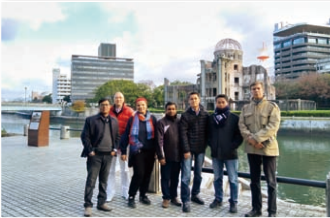
2018年12月：広島 / Hiroshima

本財団では毎年招聘奨学者を国内研修旅行に招待しております。これは、研究活動のみならず、我が国の自然、歴史、文化についてもよく理解いただくことを目的としております。2018年度は23名の奨学者が参加し、京都・奈良・広島を訪れました。