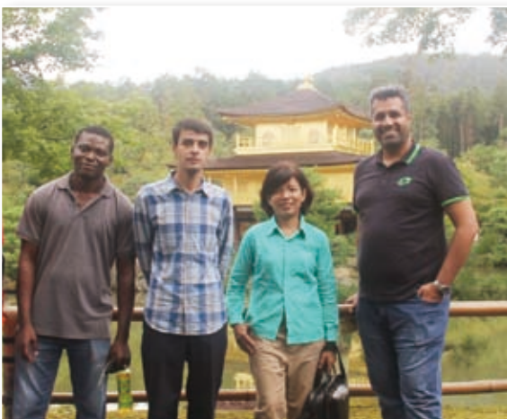
2018年9月：京都 / Kyoto