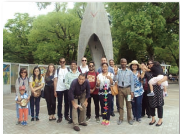
2018年6月：広島 / Hiroshima