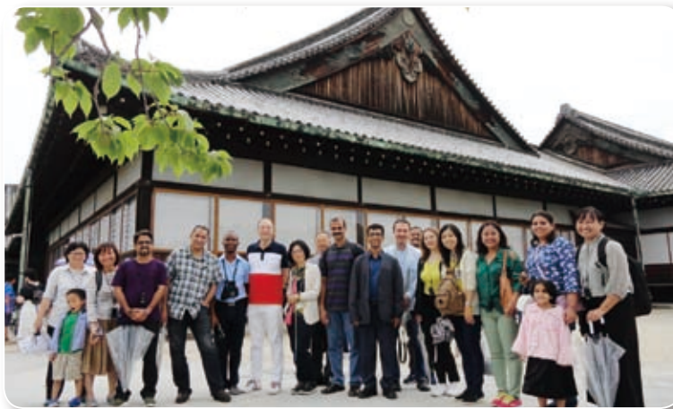
2018年6月：奈良 / Nara