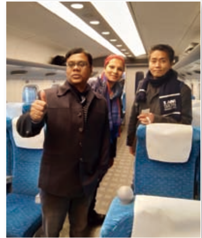
2018年12月：新幹線 / Shinkansen